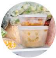
Deep Freeze Label