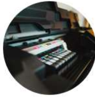
Digital inkjet Label