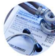
Hospital Wristband Label

ซึ่งกลุ่มผลิตภัณฑ์ดังกล่าวนี้ จะช่วยเพิ่มรายได้เนื่องจากเป็นกลุ่มที่มูลค่าสูง (high value)